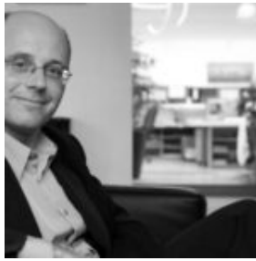
LUC WEIZMANN OU LA MÉMOIRE DE L'EAU