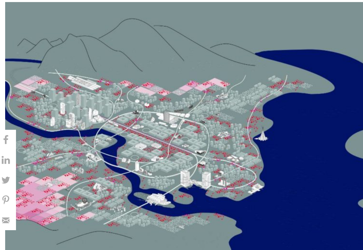
Loci-City