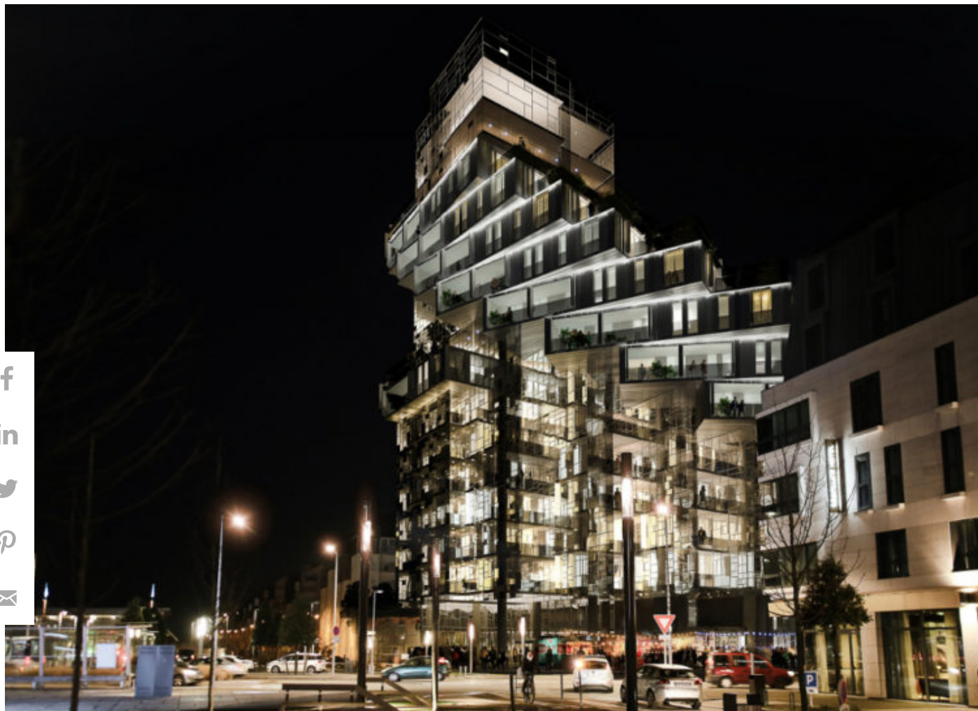
Logements à Saint-Malo

Le Tribunal de Grande Instance (TGI) de Renzo Piano , visible à travers les fenêtres de l'agence, a du mal également à passer pour une tour. Loci Anima était en finale, associé à Vinci pour ce TGI en PPP. Son projet proposait une tour fine comme une lame pour l'administration tandis qu'un 'palais' rendait toute sa solennité et sa symbolique à la justice. Elle se souvient avoir assisté à des réunions de financement avec des banquiers. «Au début nous ne comprenions rien mais cela nous a permis d'appréhender un certain nombre d'éléments dans le montage du projet dont nous ne savions rien de prime abord» , dit-elle. C'est toujours bon à savoir même si les PPP se font rares.