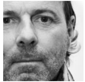
PHILIPPE PROST, L'ARCHITECTE QUI NE SAVAIT PAS QU'IL ÉTAIT ARCHITECTE