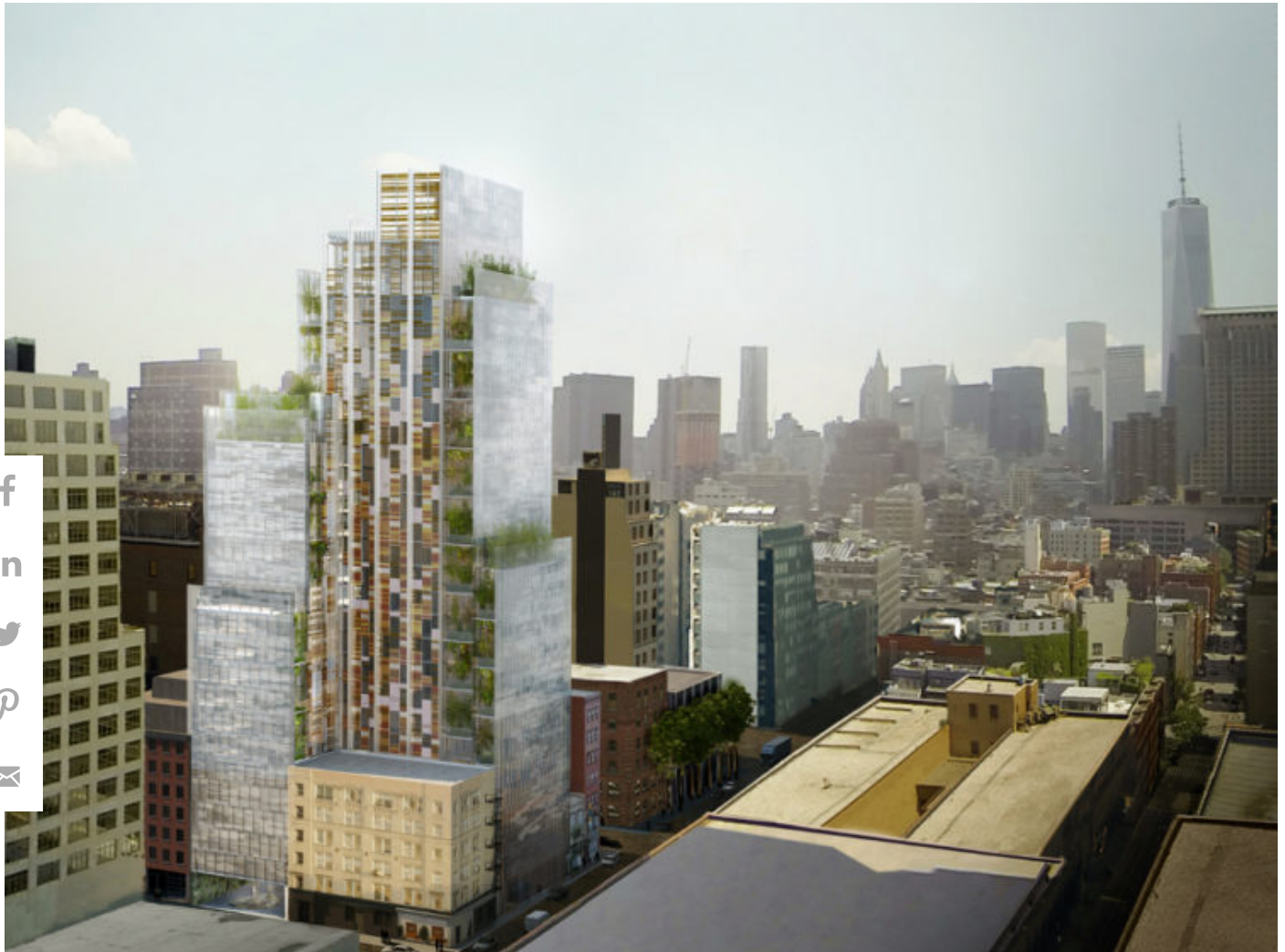
New York @ Arte factory Lab

Des tours, elle en a toujours construit, ici et ailleurs, ce qui est la moindre des choses pour une architecte qui a commencé sa carrière chez Jean Nouvel avec la Tour sans fin. De la tour à New York actuellement en construction aux tours d'Issy-les-Moulineaux livrées en mars 2018, en passant par Strasbourg et Saint-Malo, ses tours de logements, dont elle manipule les maquettes avec affection, sont au cœur des problématiques de densité actuelles. « C'est difficile, je ne peux pas dire : 'non, je ne sais pas faire des tours' ». Comment ne pas être cataloguée ?